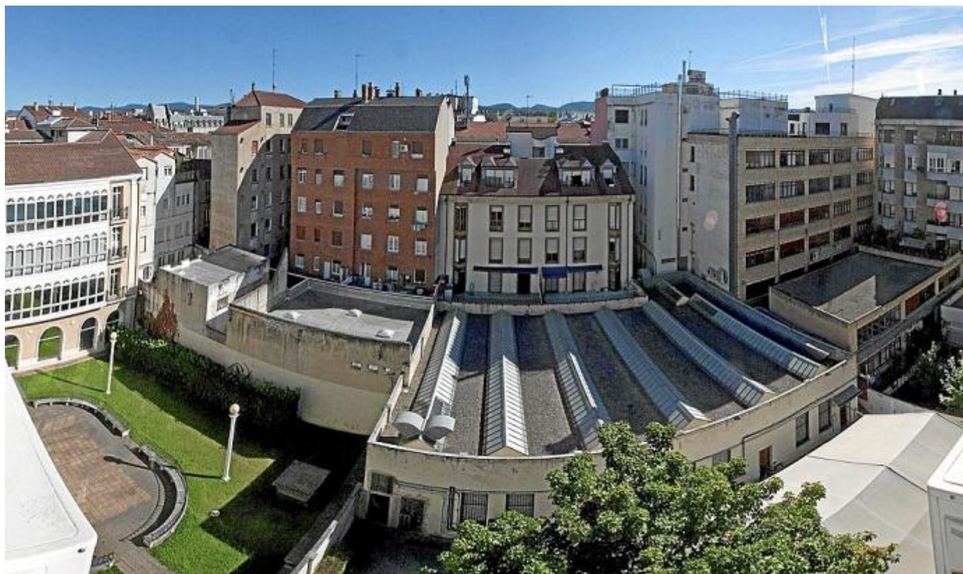
Imagen de la manzana del antiguo frontón vitoriano, que posee un núcleo, razonablemente libre, a la cota más baja que permite estructurar el diseño de los jardines, posibilitando plantaciones vegetales que minimicen el efecto de isla de calor durante el verano.

VITORIA – En pleno confinamiento, a más de un vecino del Ensanche vitoriano le vino a la cabeza por qué razón esos patios interiores que dan a alguna de sus ventanas estaban tan infrautilizados , aparte de en decadencia, debido al inevitable paso del tiempo. Sin ir más lejos, algo parecido es lo que le sucedió a Rosa Murguía Quincoces y eso que desde su piso, en la calle San Antonio, a la altura del conocido PerretxiCo de Merino , no le da a la manzana del antiguo frontón vitoriano.